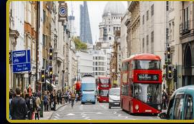
Türkiye'de 3 FTVT Token irtibat ofisi daha açılıyor. Dünya'da 4 şehirde daha FTVT Token irtibat ofisi açılacaktır.