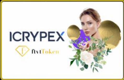
FTVT Token 01 Kasım 2022 tarihinde ICRYPEX Kripto para borsasında ön satışa sunuldu.