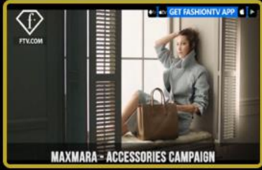
Çanta ve Aksesuarları Mağazaları Türkiye'de 5 ve Dünya'da 15 mağaza daha açıyor.