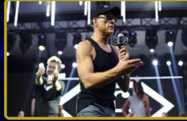
Tüm dünyada toplamda 18 adet Spor Salonu - Fitness & Sauna merkezi daha açılıyor!