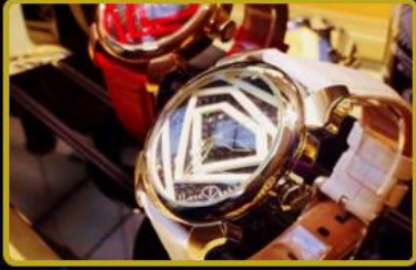
Saat ve Aksesuarları mağazaları açılıyor, 2026 hedefi tüm dünyada 12 Mağaza!