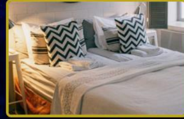
Fashion TV Ev Tekstili Mağazaları Türkiye ve Dünya'nın seçkin şehirlerinde! 2026 hedefi toplamda 25 Mağaza.