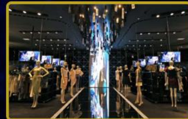
Tüm dünyada toplamda 25 adet f.Store daha hizmete girecek. f.Store avantajları için FTVT Token almalısınız!