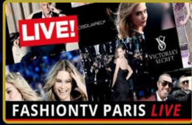
Türkiye'de ve Dünya'da 2029 yılı boyunca toplamda 24 farklı parti ve Fashion TV Week organizasyonu FTVT Token kullanıcılarına ücretsiz!