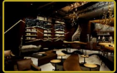
Türkiye'de 5 ve Dünya'da 20 adet Fashion TV Kahve Dükkanları açılacaktır.