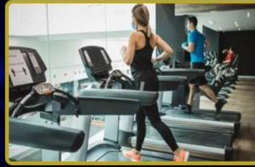
Tüm dünyada toplamda 18 adet Spor Salonu - Fitness & Sauna merkezi daha açılıyor!