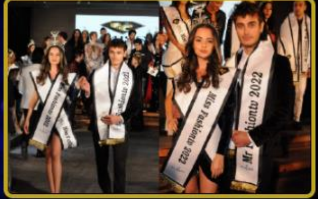
FTVT Token Sponsorluğunda Mr & Ms. fashion tv Güzellik Yarışması İstanbul'da yapıldı.