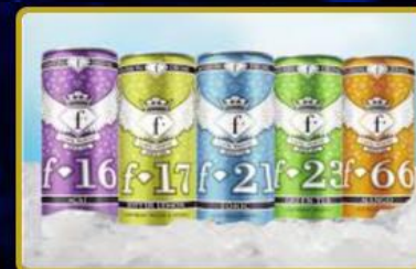
Fashion TV Energy Drink Dünya'ya 3 farklı ülkeye daha dağıtılıyor.