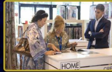
Fashion TV Ev Tekstili Mağazaları Türkiye ve Dünya'nın seçkin şehirlerinde! 2029 hedefi toplamda 50 Mağaza.