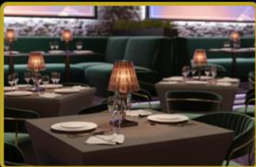
Türkiye'de 1 ve Dünya'da 3 adet daha Fashion TV Restaurant, FTVT Token kullanıcılarına sürpriz indirimlerle faaliyete giriyor!