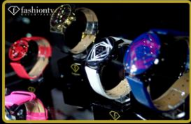
Saat ve Aksesuarları mağazaları açılıyor, 2029 hedefi tüm dünyada 12 Mağaza!