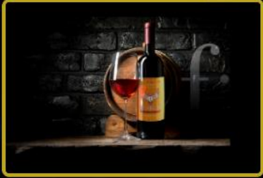
f.WINE Özel Şarap Serisi, f.Commerce ve f.Store platformlarında.