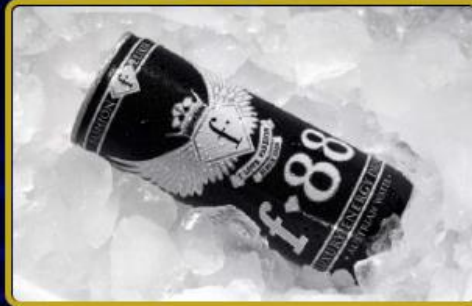
fashion tv Enerji içeceği tüm Türkiye'de