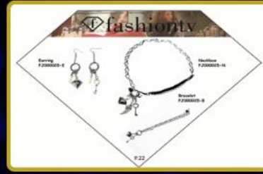
Türkiye'de 20, Dünya'da 40 adet Fashion TV Aksesuar & Bijuteri Mağazası daha hizmete girecektir.