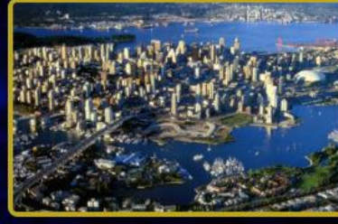
Türkiye'nin ilk FTVT Token irtibat ofisi İstanbul'da açılıyor. Dünya'da 2 şehirde FTVT Token irtibat ofisi açılacaktır.