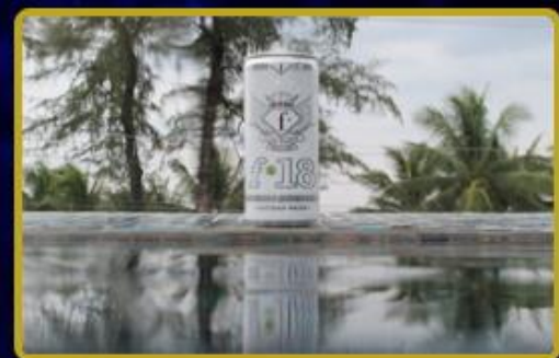
Fashion TV Energy Drink Dünya'ya 3 farklı ülkeye daha dağıtılıyor.