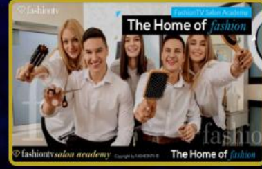
Fashion Akademi ve Moda Okulları Türkiye'de ve Dünya'da açılıyor. Toplam akademi sayısı 8'e ulaşıyor!