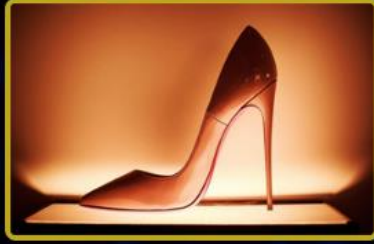
Fashion TV Ayakkabı & Terlik Mağazaları 2026 yılında tüm dünyada 23 Mağazayı ekosistemi içerisine dahil ediyor.