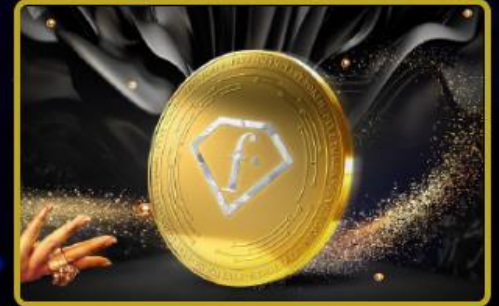
FTVT Token Lansmanı