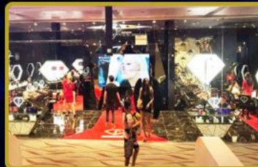
Kişisel Bakım ve Kozmetik Mağazaları açılmaya devam ediyor. Türkiye'de 10 ve Dünya'da 20 adet mağaza daha 2026 yılında faaliyete geçecek