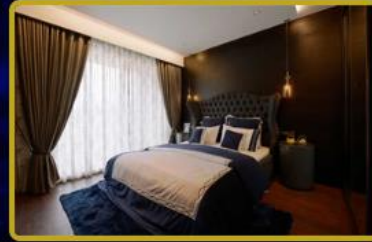
Türkiye'deki ikinci Fashion TV Oteli açılıyor. Dünya'nın 2 farklı lokasyonunda daha Fashion TV Otelleri açılacak.