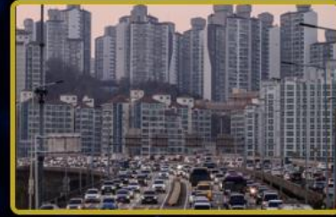
Türkiye'de 3 FTVT Token irtibat ofisi daha açılıyor. Dünya'da 4 şehirde daha FTVT Token irtibat ofisi açılacaktır.