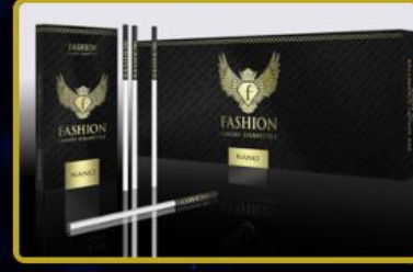
Fashion TV Tabacco ürünleri dünyanın 3 farklı ülkesinde faaliyete açılıyor.