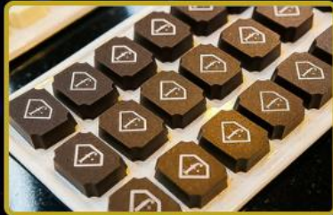
Çikolata ve Gurme ürünlerinde Türkiye'de 1 ve Dünya'da 10 Mağaza 2026 yılında açılacaktır.