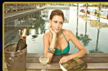
f. Travel Dünya'da toplamda 3 Acenta daha açıyor!