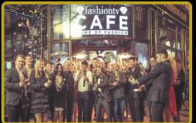
Türkiye'de 1, Dünya'da 2 adet Fashion TV Club & Bar hizmete girecektir.