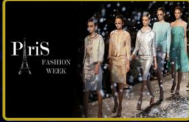
Türkiye'de ve Dünya'da 2026 yılı boyunca toplamda 24 farklı parti ve Fashion TV Week organizasyonu FTVT Token kullanıcılarına ücretsiz!