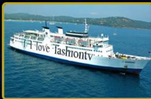
f. Travel Dünya'da toplamda 3 Acenta daha açılıyor.