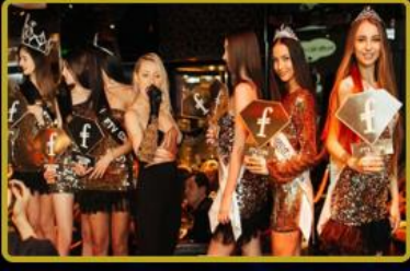
Türkiye'de ve Dünya'da 2023 yılı boyunca toplamda 24 farklı parti ve Fashion TV Week organizasyonu FTVT Token kullanıcılarına ücretsiz!