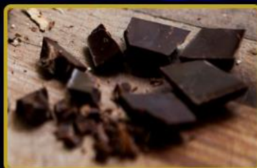
Çikolata ve Gurme ürünlerinde Türkiye'de 1 ve Dünya'da 10 Mağaza daha 2029 yılında açılacaktır.