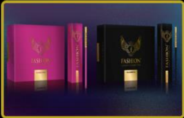
Fashion TV Tabacco ürünleri Türkiye'de 2nci mağazasını açıyor. Dünyada 10 farklı ülkede daha faaliyete açılıyor.