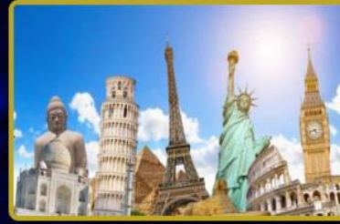
Türkiye'de 3 FTVT Token irtibat ofisi daha açılıyor. Dünya'da 4 şehirde daha FTVT Token irtibat ofisi açılacaktır.