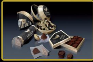
Çikolata ve Gurme ürünlerinde 4 mağaza Türkiye'de ve Dünya'da 2023 yılında açılacaktır.