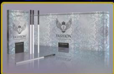
Fashion TV Tabacco ürünleri Türkiye'de 4ncü mağazasını açıyor. Dünyada 10 farklı ülkesinde daha faaliyete açılıyor.