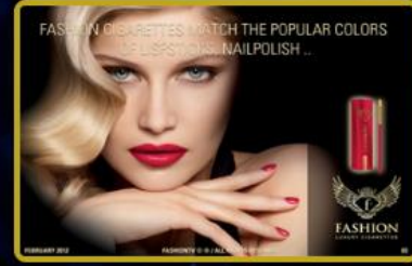
Fashion TV Tabacco ürünleri Türkiye'de 4ncü mağazasını açıyor. Dünyada 10 farklı ülkesinde daha faaliyete açılıyor.