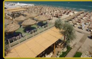
2026 yılı içerisinde Dünya'da 1 adet daha Fashion TV Beach açılacaktır.