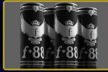
Fashion TV Energy Drink üretim tesisi Gaziantep'te büyütülüyor ve Tüm Türkiye'ye ve Dünya'ya 3 farklı ülkeye dağıtılıyor.