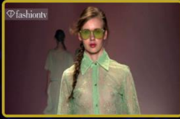
Türkiye'de ve Dünya'da 2028 yılı boyunca toplamda 24 farklı parti ve Fashion TV Week organizasyonu FTVT Token kullanıcılarına ücretsiz!