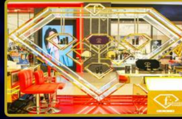
5 Health, Beauty and Aesthetic Centers in Turkey and 10 in the world will be opened. Surprise discounts for FTVT Token users