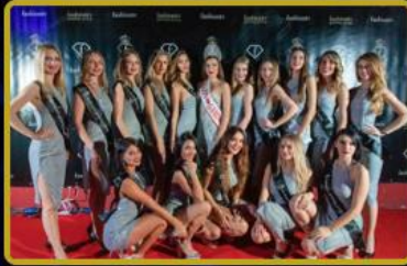
FTVT Token ana sponsorluğunda, dünyada 7 ülkede Mr & Ms. Fashion Güzellik yarışmaları düzenlenecektir.