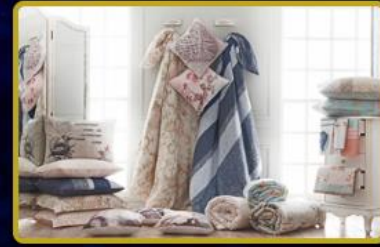
Fashion TV Ev Tekstili Mağazaları Türkiye ve Dünya'nın seçkin şehirlerinde! 2028 hedefi toplamda 50 Mağaza.