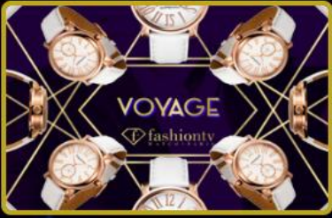
Saat ve Aksesuarları mağazaları açılıyor, 2028 hedefi tüm dünyada 12 Mağaza!