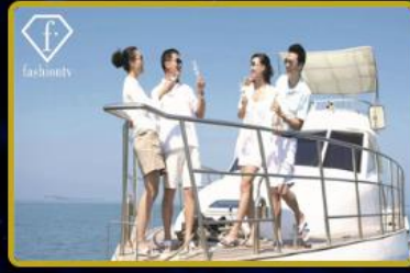
f. Travel Dünya'da ilk Acentasını açıyor!