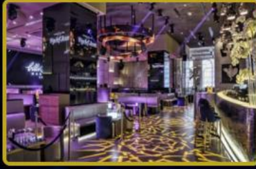
2026 yılında Türkiye'de 3 ve Dünya'da 7 adet Cafe açılışı yapılacaktır.