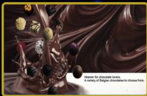
Çikolata ve Gurme ürünlerinde Türkiye'de 1 ve Dünya'da 10 Mağaza daha 2028 yılında açılacaktır.