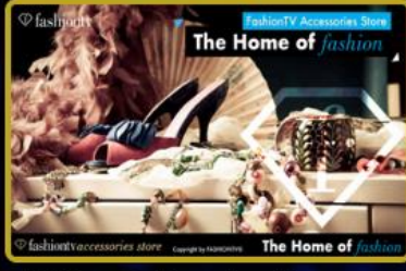
Türkiye'de 5, Dünya'da 10 adet Fashion TV Aksesuar & Bijuteri Mağazası hizmete girecektir.