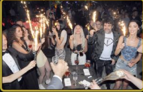
fashion tv 25.yıl kutlamaları FTVT Token sponsorluğunda İstanbul Oligark'ta 21 Haziran 2022 tarihinde yapıldı