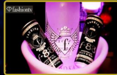
Fashion TV Energy Drink Dünya'ya 3 farklı ülkeye daha dağıtılıyor.