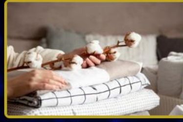
Fashion TV Ev Tekstili Mağazaları Türkiye ve Dünya'nın seçkin şehirlerinde! 2023 hedefi toplamda 15 Mağaza.