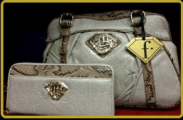
Çanta ve Aksesuarları Mağazaları Türkiye'de 5 ve Dünya'da 15 mağaza daha açılıyor.