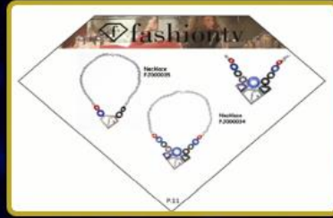
Türkiye'de 20, Dünya'da 40 adet Fashion TV Aksesuar & Bijuteri Mağazası daha hizmete girecektir.