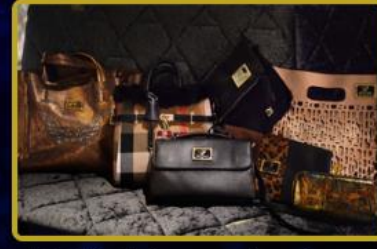
Gözde ürünlerimizden Çanta ve Aksesuarları Mağazaları Türkiye'de 3 ve Dünya'da 15 mağaza açılıyor.